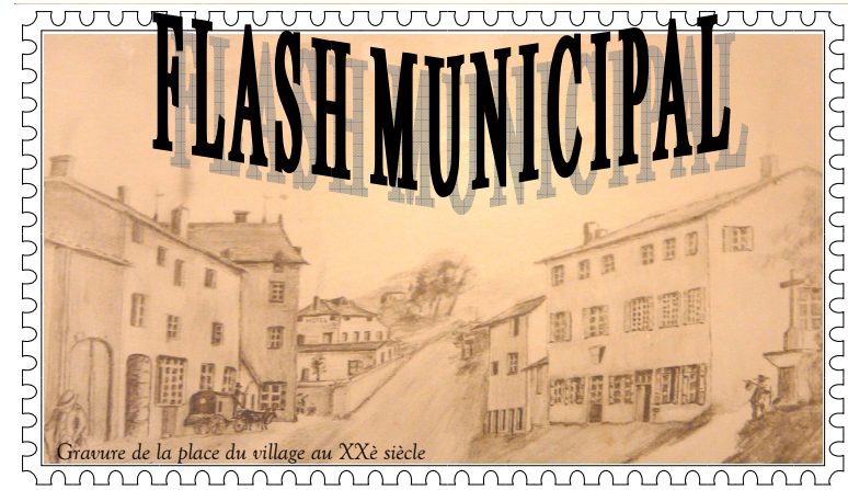
Gravure de la place du village au XX e siècle

Dans le cadre de Roanne Table Ouverte qui se déroule sur le roannais entre septembre et octobre 2011 depuis plusieurs années, un repas champêtre avec animation vous sera proposé sur notre commune le dimanche 25 septembre à midi, par les commerçants de St Denis. Merci de réserver d'ores et déjà votre dimanche, nous vous transmettrons de plus amples renseignements dans les prochaines semaines.